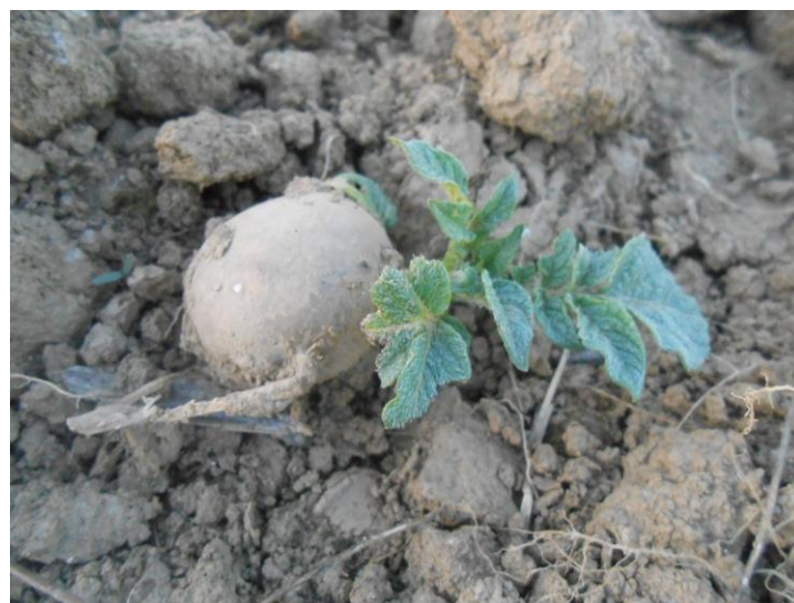
Sl.2: Rano klijanje krtola na površini zemlje.