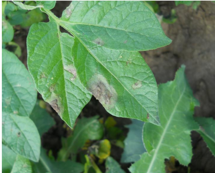
Sl. 3. Prvi simptomi Ph. infestans na krompiru sorte Riviera.