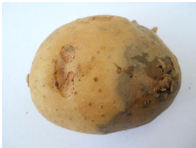
Sl. 5. Simptomi Ph. infestans na krtoli krompira.