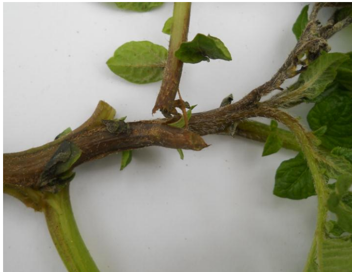
Sl.4: Simptomi Ph infestans na stablu krompira.