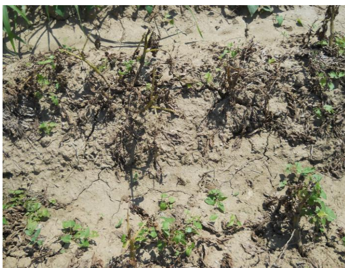
Sl.6: Osušena cima krompira posle ječe infekcije Ph. Infestans .

Novi A2 polni tip ima kraći latentni period ili između infekcije i pojave simptoma. Tako kod A1 latentni period je bio 5-7 dana, a kod A2 je oko 3-5 dana. u povoljnim uslovima. Kod Ph infestans kao obligatnog parazita, osetljivost sorata krompira je prevashodnog značaja za brzinu razvića ali i vitalni indikator u epizoološkom smislu, odnosno u širenju bolesti. Kraći latentni period znači veći broj generacija u toku godine. Soj A2 je agresivniji što je glavni razlog zašto je A2 za svega nekoliko godina zamenio značajno A1 polni tip. Ph.infestans A2 tip sa kraćim latentnim periodom odnosno bržim razvićem, većom agresivnošću, većim potencijalom inokuluma daleko je destruktivniji i zahteva mere suzbijanja isključivo preventivne tretmane ili pre kiše.